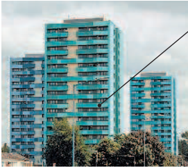
아파트 многоквартирный дом